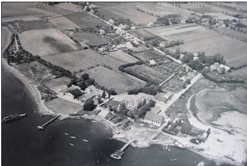
Luftfoto af Klintebjerg havn, ca. 1950. Her ses den markante lagerbygning udfor skibbroen, skalleværket til venstre, købmandsgården bag lagerbygningen.

Den ene virksomhed efter den anden skød op – eddikefabrik, saltværk med bødkeri, skalleværk, cirkorietørreri og så selvfølgelig udskibningen af korn og andre varer, ligesom indførsel af varer til især Odense voksede markant. Det medførte også oprettelsen af et toldsted.