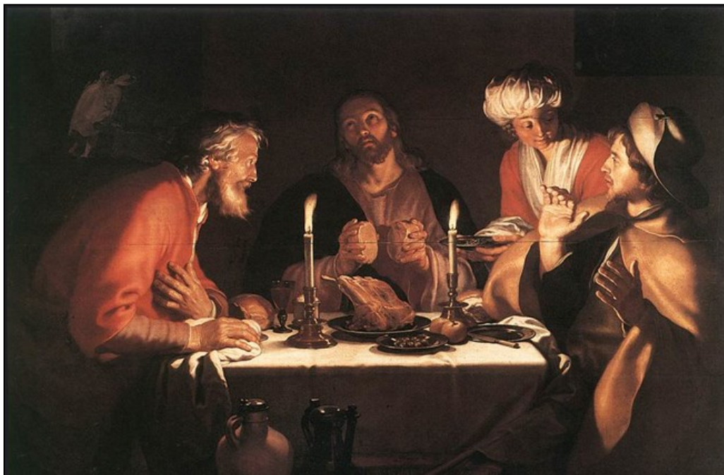
Jesus, der viser sig for to disciple i Emmaus

Et livsvilkår er dog, at vi ligesom de to disciple på vej til Emmaus ikke kan genkende Jesus, Frelseren. Men han er der.