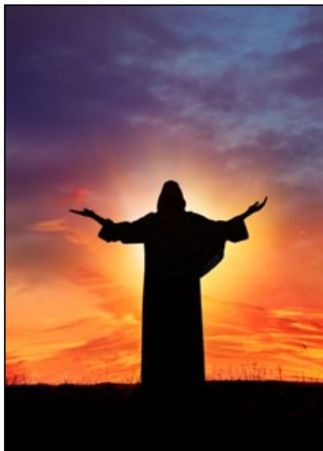
Opstandelsen / Foto: D-Keine

Sammen med opstandelsen påskemorgen udtrykker korsfæstelsen derimod, at der intet er, der ikke kan heles af Gud. Selv døden overvindes. Gud har ikke forladt os. Heller ikke i døden. De to disciple, der møder Jesus, da de 2. påskedag er på vej til Emmaus, genkender ham først, da han på samme måde, som han havde gjort ved det sidste måltid Skærtorsdag, velsigner brødet, deler det og giver dem det. Herefter bliver Jesus usynlig for de to disciple, men de kan vidne om, hvad der er sket.