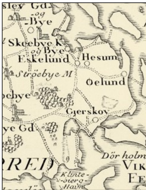
Udsnit af Videnskabernes Selskabs kort over Fyn 1780. Her ses, at Skeby Kirke ligger helt ud til kysten i Egense Fjord og at koncentrationen af landsbyer er mod nord med Gerskov som undtagelsen mod syd.

Vi kommer dog frem til 1843, hvor Odensefirmaet Ploug og Richardt opførte et stort pakhuis; skibene blev større og større og kunne ikke gå ind i den daværende kanal. Klintebjerg skulle på grund af vanddybden nu være ladeplads for Odense, og udviklingen tog yderligere fart, da landevejen mellem Hjørsløv og Klintebjerg blev åbnet under stor festivitas i 1847.